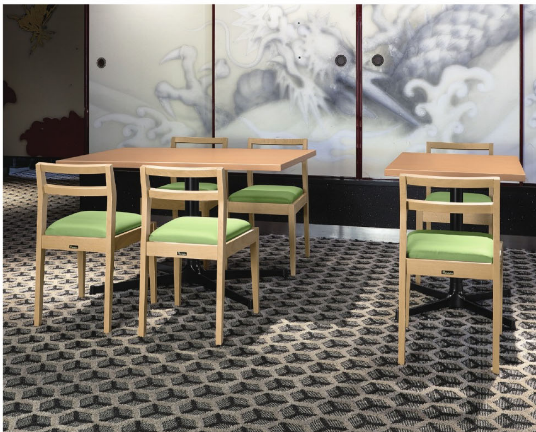
脚部 4318 天板 9305 HX- 太子Nテーブル W1200 × D750 × H700mm / 脚部 4310 天板 9300 HX- 太子Nテーブル W600 × D750 × H700mm 【P112 記載】 張地 / プレザント PL-61 (A)