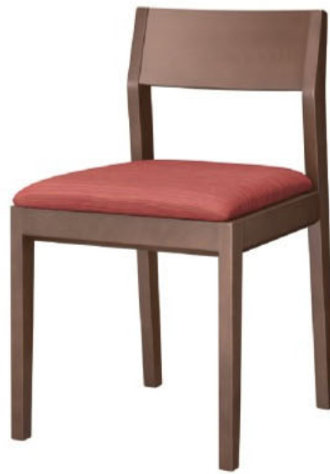
1235 河内 D 椅子 張地: デコア L-6315 (C)