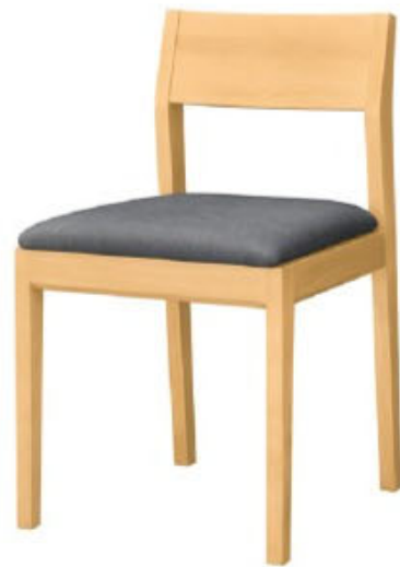
1035 河内 N 椅子 張地: デニムII UP-5378 (C)