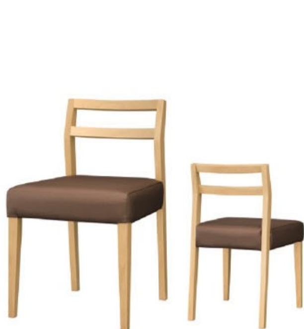
1085 伊豆 N 椅子 張地：マニエラ L-6365 (C)