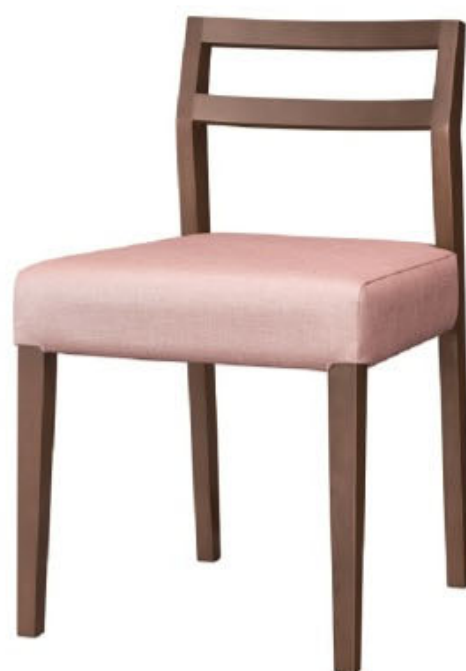
1185 伊豆 D 椅子 張地：シルキーラスタル UP-5245 (B)