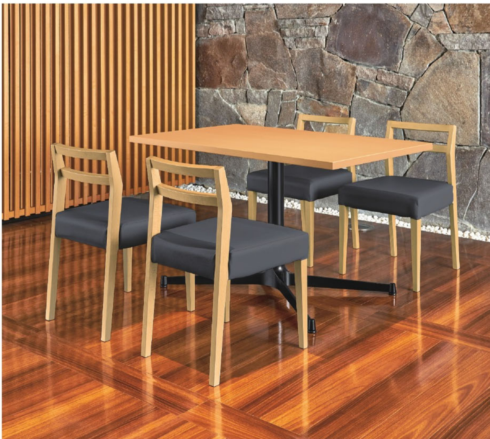
脚部 4318 天板 9205 HX 一対 N テーブル W1200 × D750 × H700 mm 【P113 記載】 張地/カラーレザー UP-5013 (A)