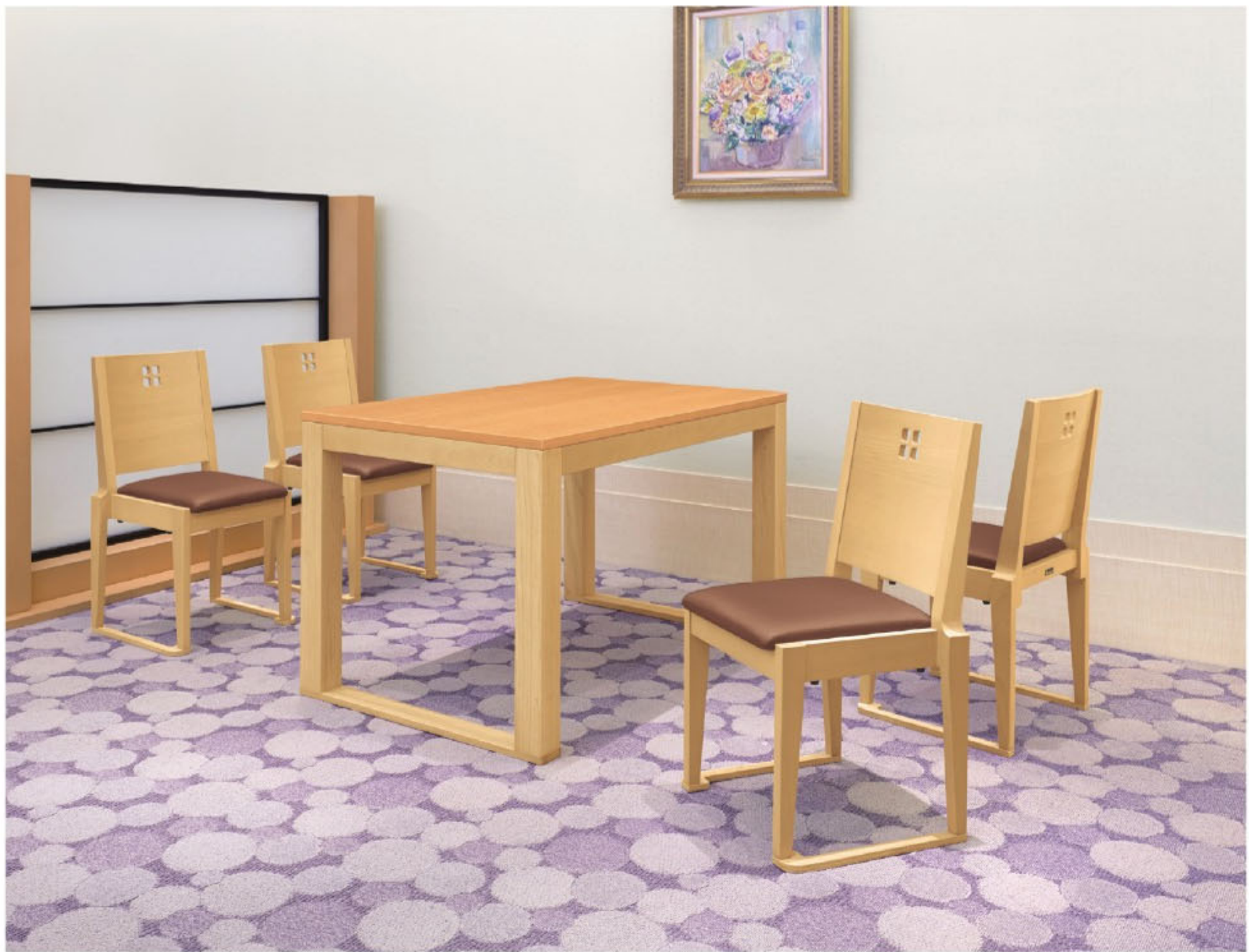
脚部 4370-4970 天板 9327-4027 H長門I N ソリ付-長門 N テーブル W1200 × D750 × H700 mm 【P108 記載】 張地/クレンズII L-6700 (A)