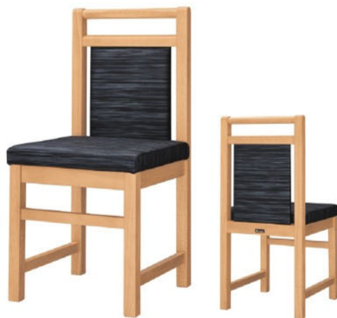
1040-1655 矢吹 N 椅子 張地: デコア L-6321 (C)