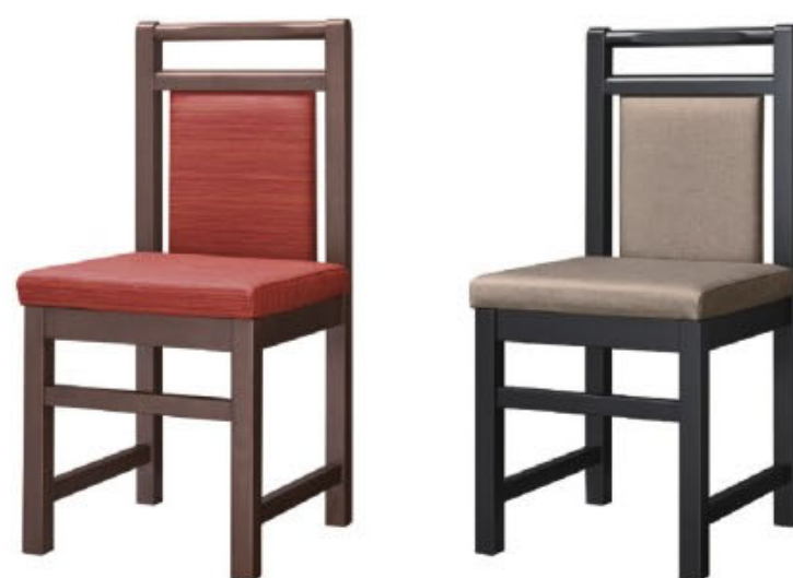
1140-1655 矢吹 D 椅子 張地: デコア L-6315 (C)