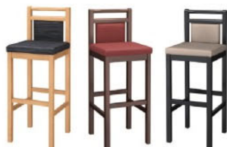
1340-1655 矢吹 B 椅子 張地: シルキーラスタル UP-5243 (B)