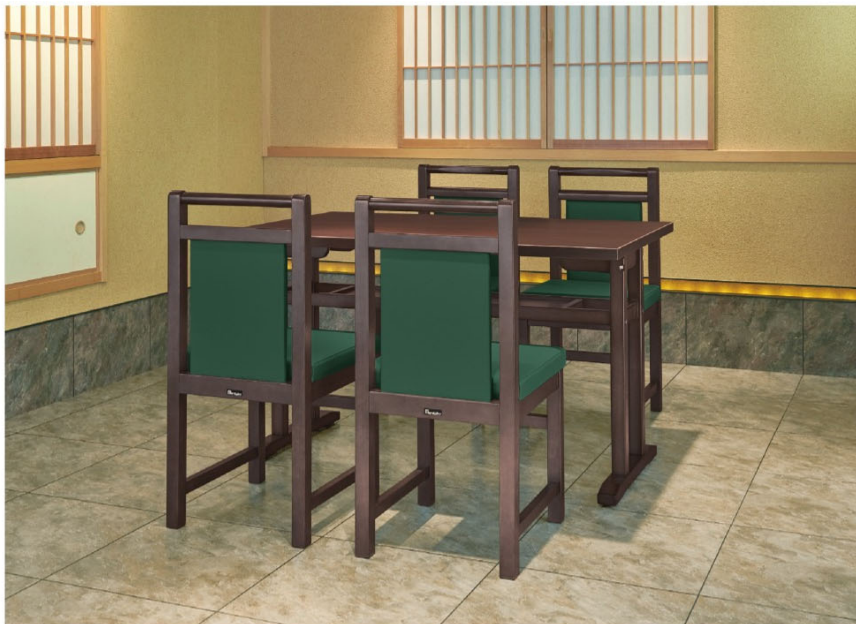
脚部 4710-4716 天板 9215 HLD 棚付-大間 D テーブル W1200 × D750 × H700 mm 【P113 記載】 張地 / クレンズ II L-6694 (A)