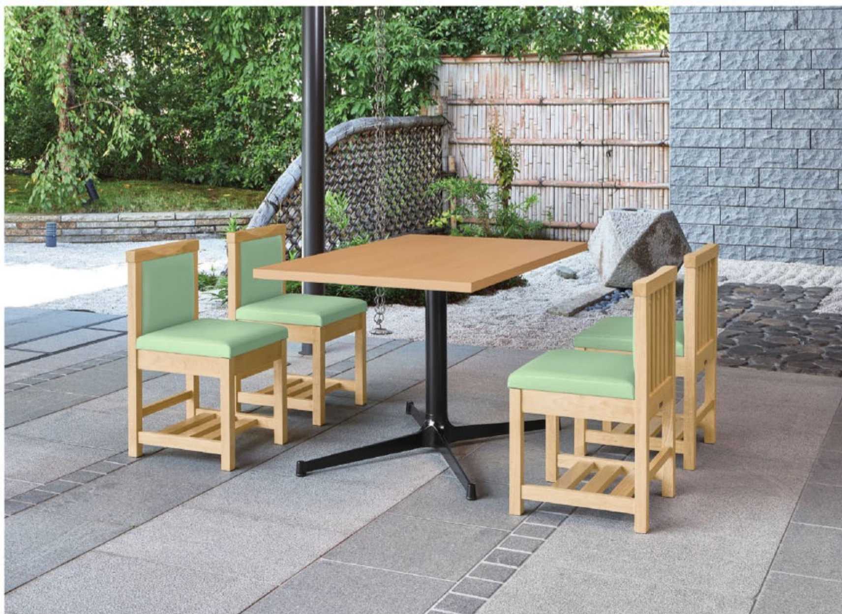
脚部 4318 天板 9305 HX- 太子Nテーブル W1200 × D750 × H700mm 【P112 記載】 張地/クレンズII L-6676 (A)