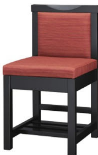
1310-1905 宇陀 B 椅子 張地：デコア L-6315 (C)