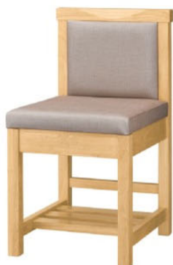
1010-1905 宇陀 N 椅子 張地：シルキーラスタル UP-5243 (B)