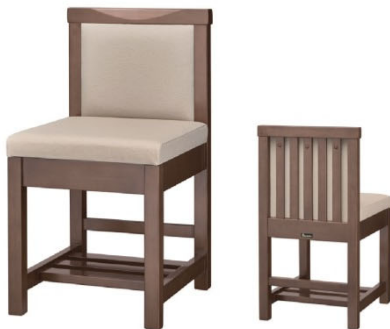
1210-1905 宇陀 D 椅子 張地：マニエラ L-6359 (C)