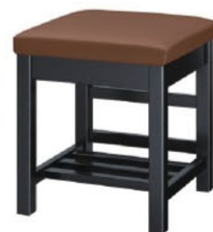
1350-1839 伊賀 B 椅子 張地: 茶レザー (既製品)