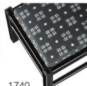
1740 カスリレザー (既製品) 張地: カスリ