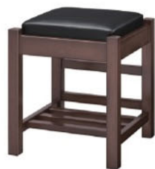
1152-1738 葛城 D 椅子 張地: 黒レザー (既製品)