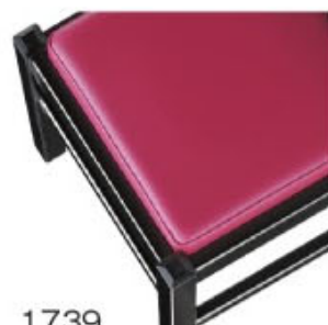
1739 赤レザー (既製品) 張地: オールマイティー L-6595