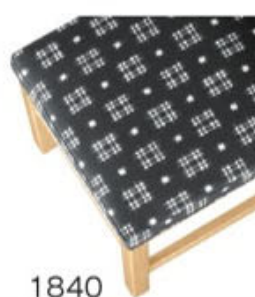
1840 カスリレザー (既製品) 張地: カスリ