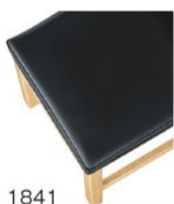
1841 黒レザー (既製品) 張地: クレンズⅡ L-6702