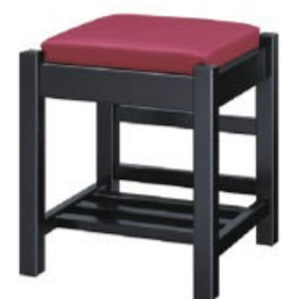
1352-1739 葛城 B 椅子 張地: 赤レザー (既製品)