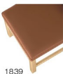
1839 茶レザー (既製品) 張地: クレンズⅡ L-6700