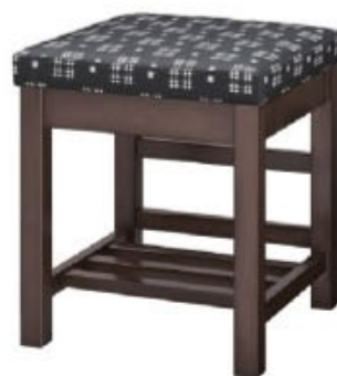
1150-1840 伊賀 D 椅子 張地: カスリレザー (既製品)