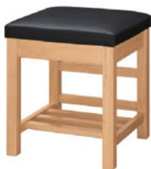
1050-1841 伊賀 N 椅子 張地: 黒レザー (既製品)