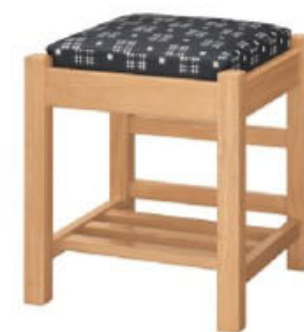
1052-1740 葛城 N 椅子 張地: カスリレザー (既製品)