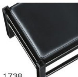
1738 黒レザー (既製品) 張地: オールマイティー L-6562