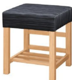
1054 宮滝 N 椅子 張地: デコア L-6321 (C)