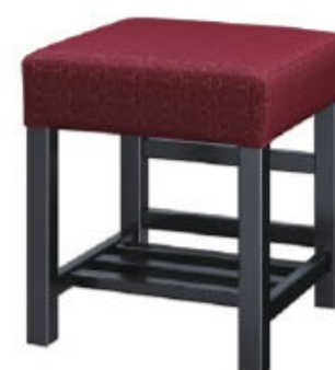
1354 宮滝 B 椅子 張地: 麻葉繫 UP-5473 (D)