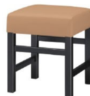
1233 保津 B 椅子 張地: クレンズII L-6697 (A)