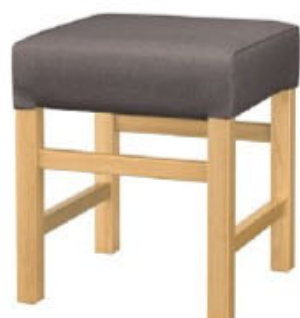
1033 保津 N 椅子 張地: マニエラ L-6353 (C)