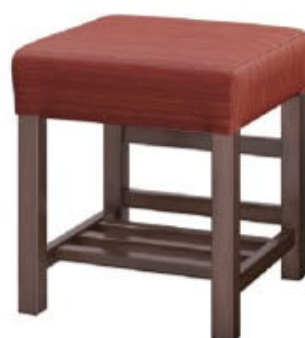
1154 宮滝 D 椅子 張地: デコア L-6315 (C)