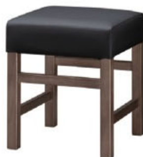
1133 保津 D 椅子 張地: クレンズII L6702 (A)