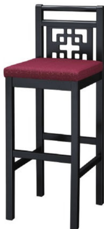
2340-2687 青島 B スタンド椅子 張地: 麻葉繫 UP-5473 (D)