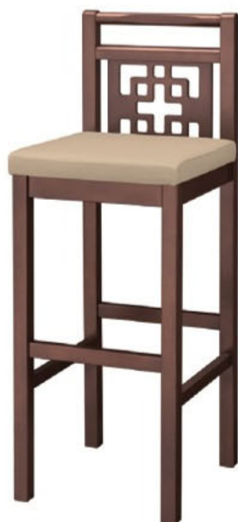
2140-2686 青島 D スタンド椅子 張地: マニエラ L-6359 (C)