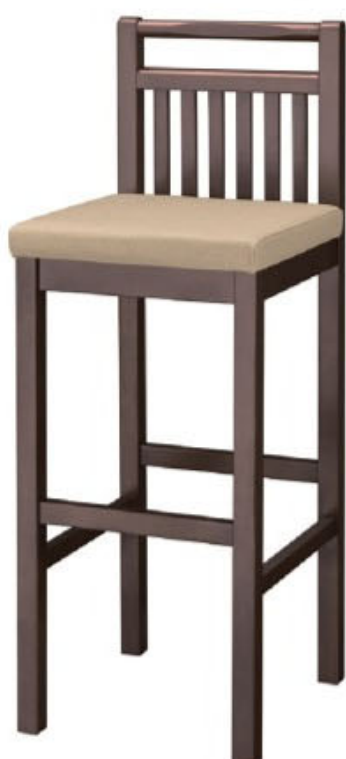
2140-2666 黒滝 D スタンド椅子 張地: マニエラ L-6359 (C)