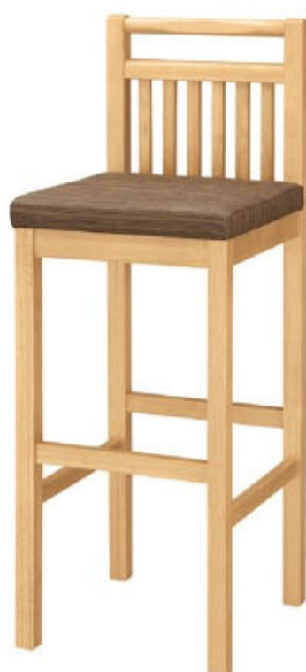
2040-2665 黒滝 N スタンド椅子 張地: デコア L-6320 (C)