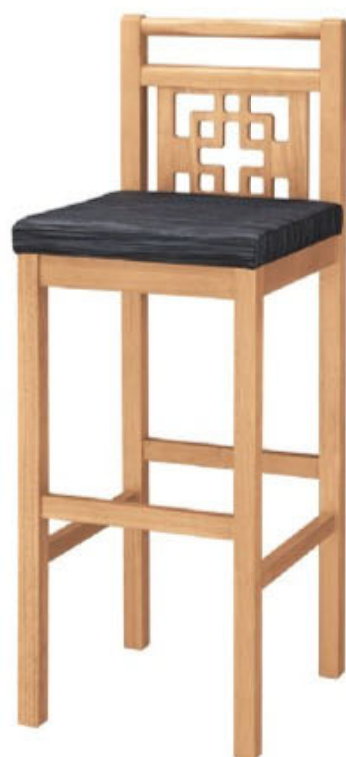
2040-2685 青島 N スタンド椅子 張地: デコア L-6321 (C)