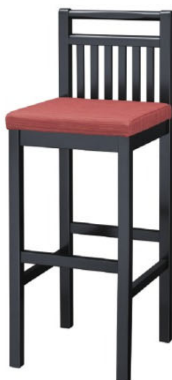
2340-2667 黒滝 B スタンド椅子 張地: デコア L-6315 (C)