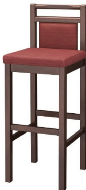
2140-2655 矢吹D スタンド椅子 張地: デコア L-6315 (C)