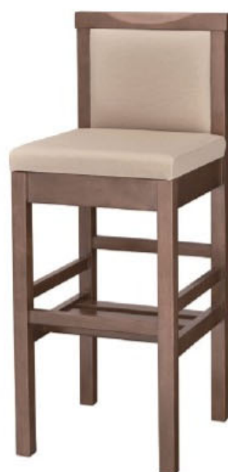
2210-1905 宇陀D スタンド椅子 張地: マニエラ L-6359 (C)