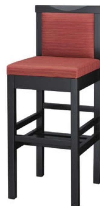
2310-1905 宇陀B スタンド椅子 張地: デコア L-6315 (C)