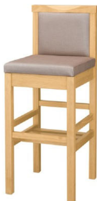
2010-1905 宇陀N スタンド椅子 張地: シルキーラスタルUP-5243 (B)