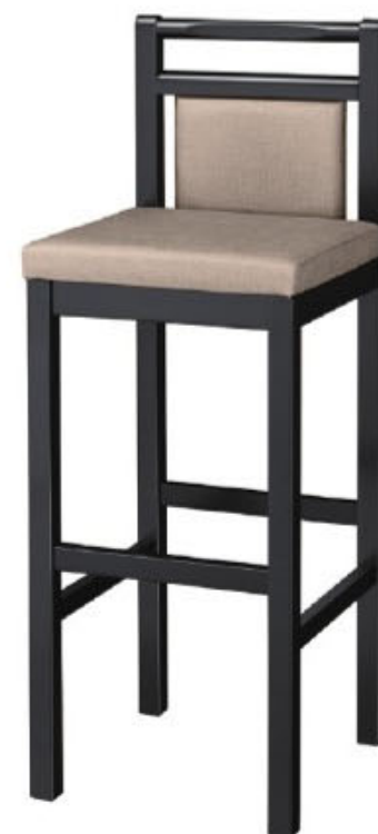
2340-2655 矢吹B スタンド椅子 張地: シルキーラスタルUP-5243 (B)