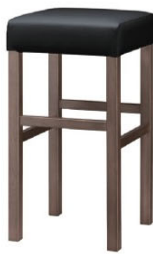
2133 保津 D スタンド椅子 張地: クレンズⅡ L-6702 (A)