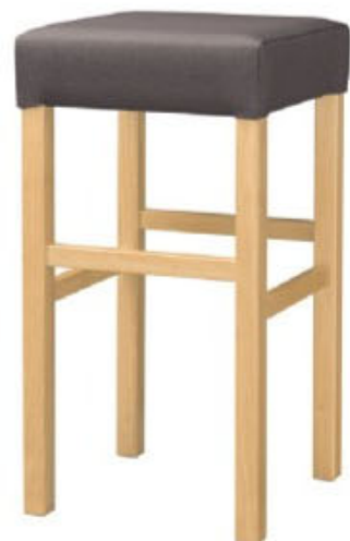
2033 保津 N スタンド椅子 張地: マニエラ L-6353 (C)