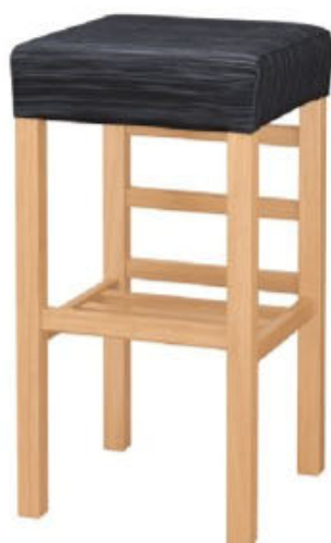
2054 宮滝 N スタンド椅子 張地: デコア L-6321 (C)