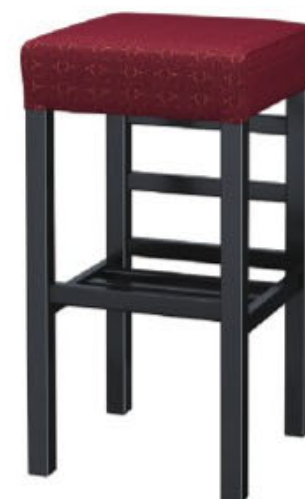
2354 宮滝 B スタンド椅子 張地: 麻葉繫 UP-5473 (D)