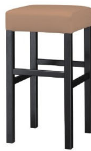
2233 保津 B スタンド椅子 張地: クレンズⅡ L-6697 (A)