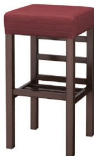
2154 宮滝 D スタンド椅子 張地: デコア L-6315 (C)