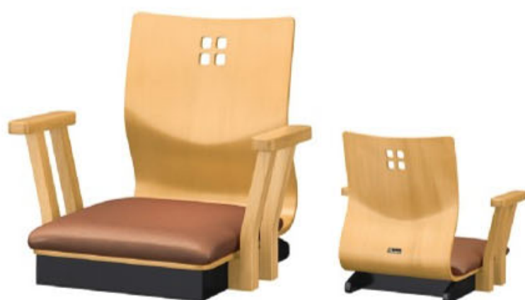
8200-8241-1923 霧島 IN 座椅子 1550×2 霧島 N アーム×2 張地: マニエラ L-6360 (C)