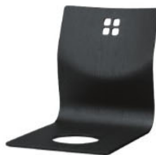
8243 羽衣 B 座椅子 ¥7,200