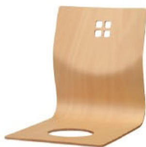
8241 羽衣 N 座椅子 ¥7,200