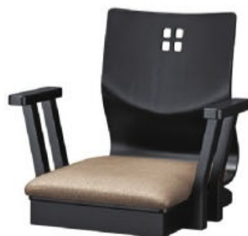
8200-8243-1923 霧島 IB 座椅子 1552×2 霧島 B アーム×2 張地: マニエラ L-6359 (C)