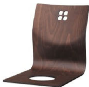
8242 羽衣 D 座椅子 ¥7,200