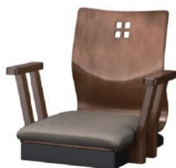
8200-8242-1923 霧島 ID 座椅子 1551×2 霧島 D アーム×2 張地: マニエラ L-6353 (C)