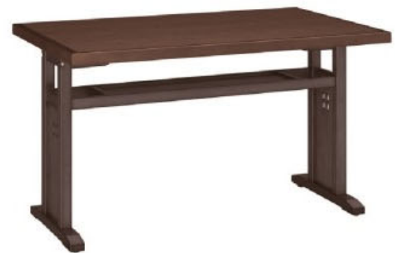
HKD 棚付 - 天美 D 脚部 4710-4771-4716 天板 9465 W1200 × D750 × H700mm ¥107,600