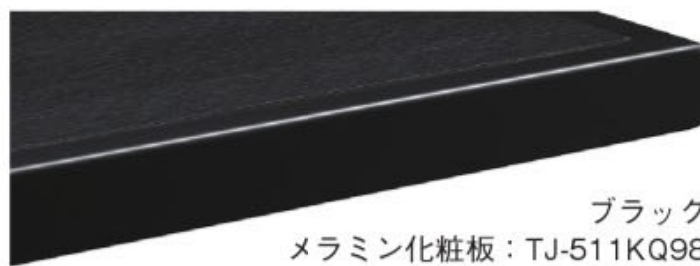
ブラック メラミン化粧板：TJ-511KQ98 指紋レス/抗菌仕様