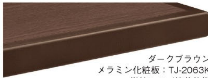
ダークブラウン メラミン化粧板：TJ-2063K 指紋レス/抗菌仕様