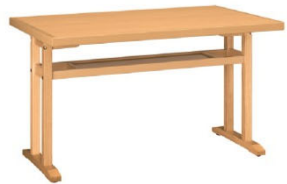
HLN 棚付 - 天美 N 脚部 4700-4706 天板 9455 W1200 × D750 × H700mm ¥100,700