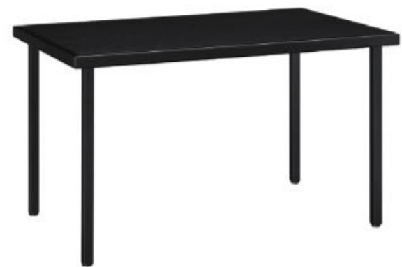
HI - 天美 B 脚部 4150 天板 9475 W1200 × D750 × H700mm ¥104,000