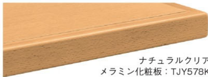
ナチュラルクリア メラミン化粧板：TJY578K 指紋レス/抗菌仕様