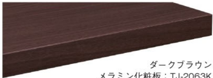
ダークブラウン メラミン化粧板：TJ-2063K 指紋レス/抗菌仕様