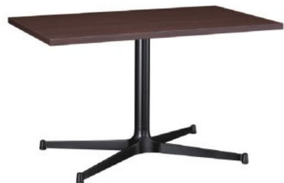
HX - 太子 D 脚部 4318 天板 9315 W1200 × D750 × H700mm ¥103,800