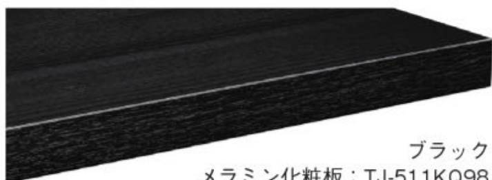
ブラック メラミン化粧板：TJ-511KQ98 指紋レス/抗菌仕様