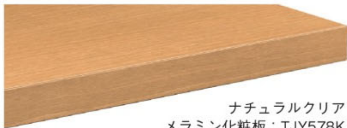
ナチュラルクリア メラミン化粧板：TJY578K 指紋レス/抗菌仕様