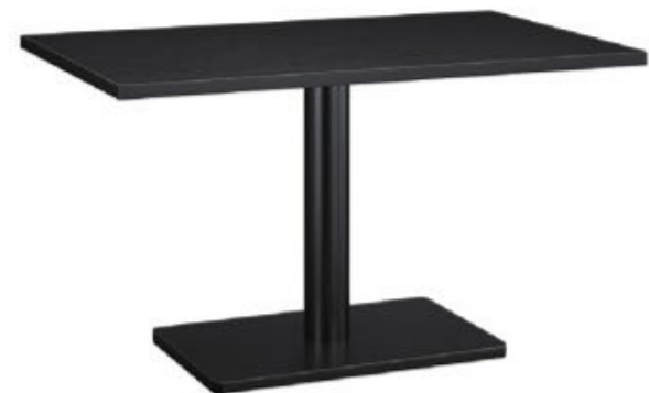
HD - 太子 B 脚部 4208 天板 9325 W1200 × D750 × H700mm ¥96,200