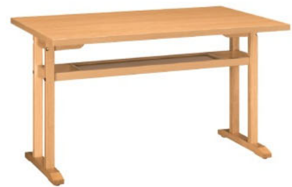
HLN 棚付 - 太子 N 脚部 4700-4706 天板 9305 W1200 × D750 × H700mm ¥86,800